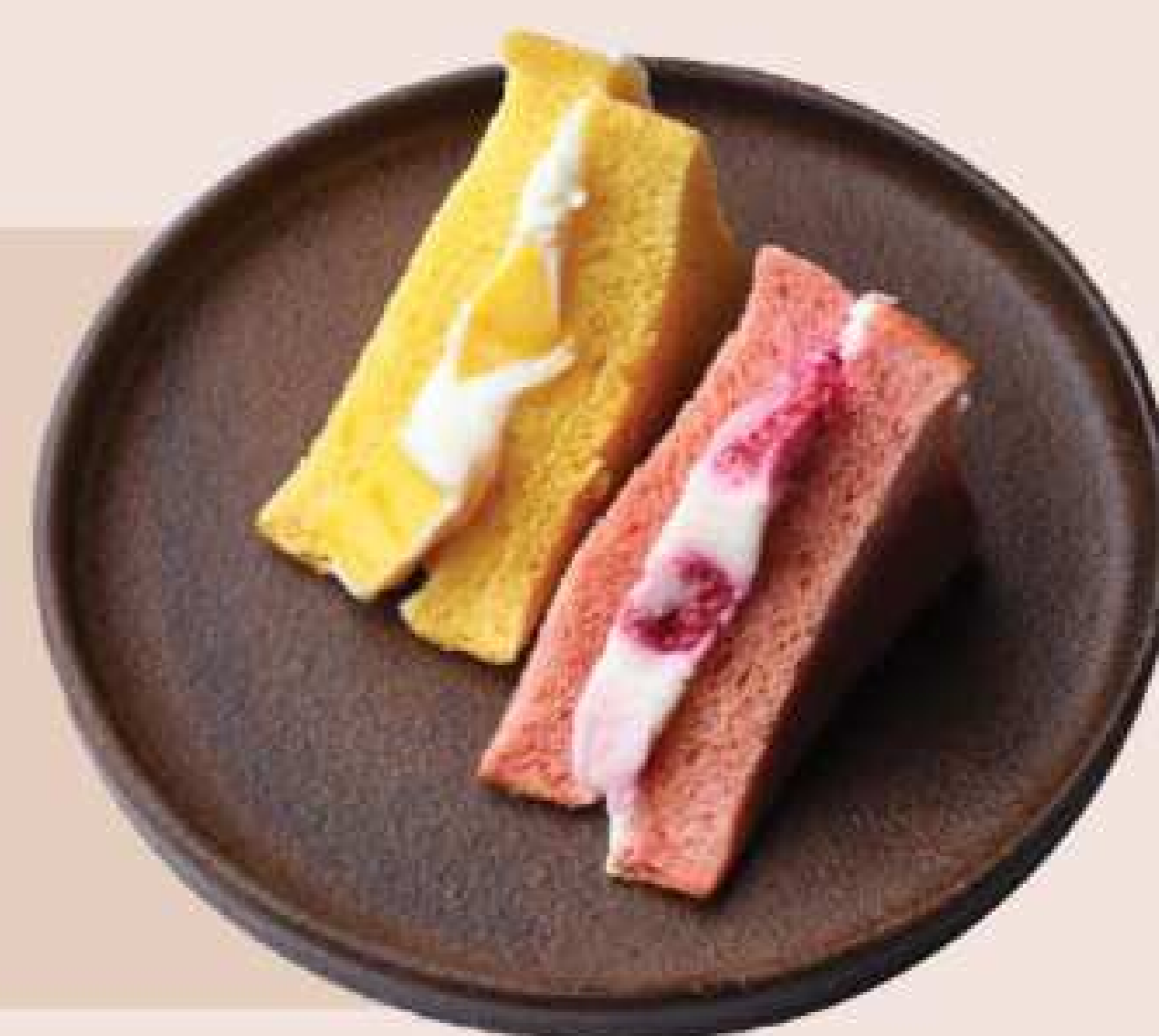
色鮮やかなフルーツサンド