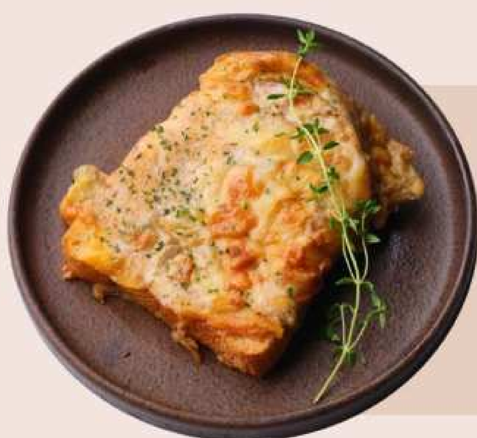
トリュフ香るクロックムッシュ

だし巻き卵を天ぷらと、マヨネーズたっぷりのポテトサラダをソース代わりにしたサンド。