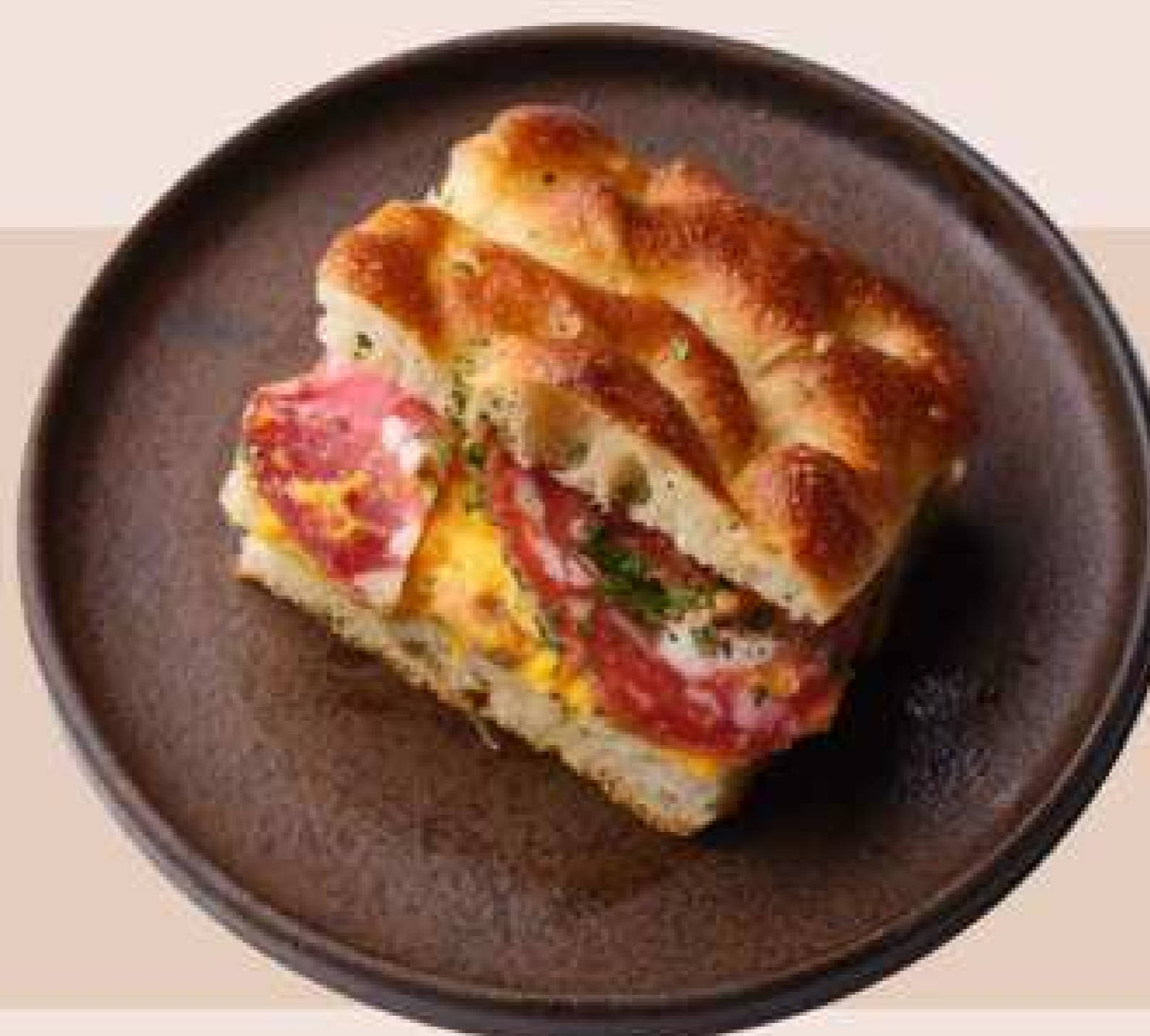
チョイスできるデリカテッセンサンド