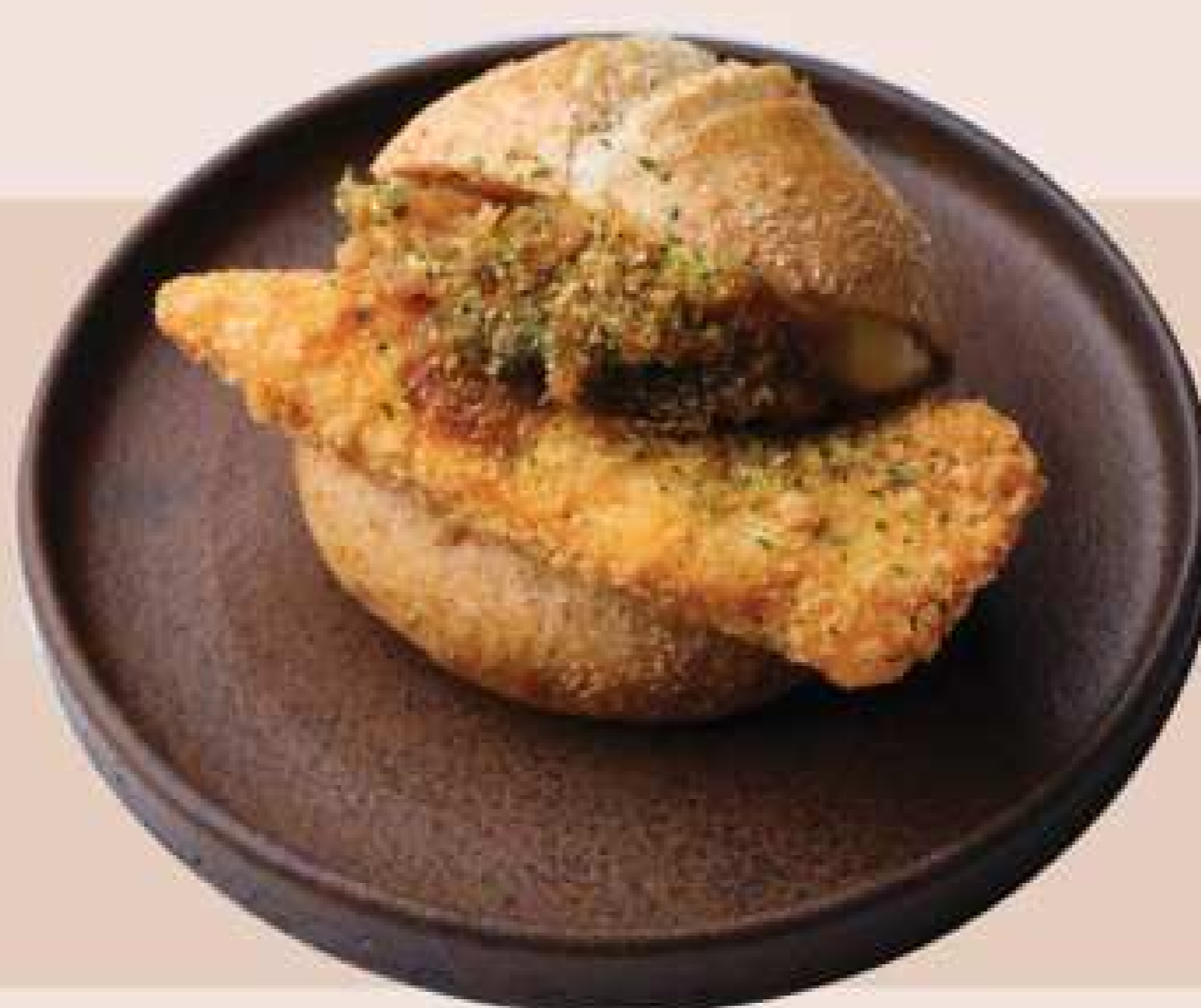
チーズとろけるカツカレーパン

全粒粉ロールにチキンカツ、シェフ特製のカレー、チーズクリームをサンドしたカレーパン。