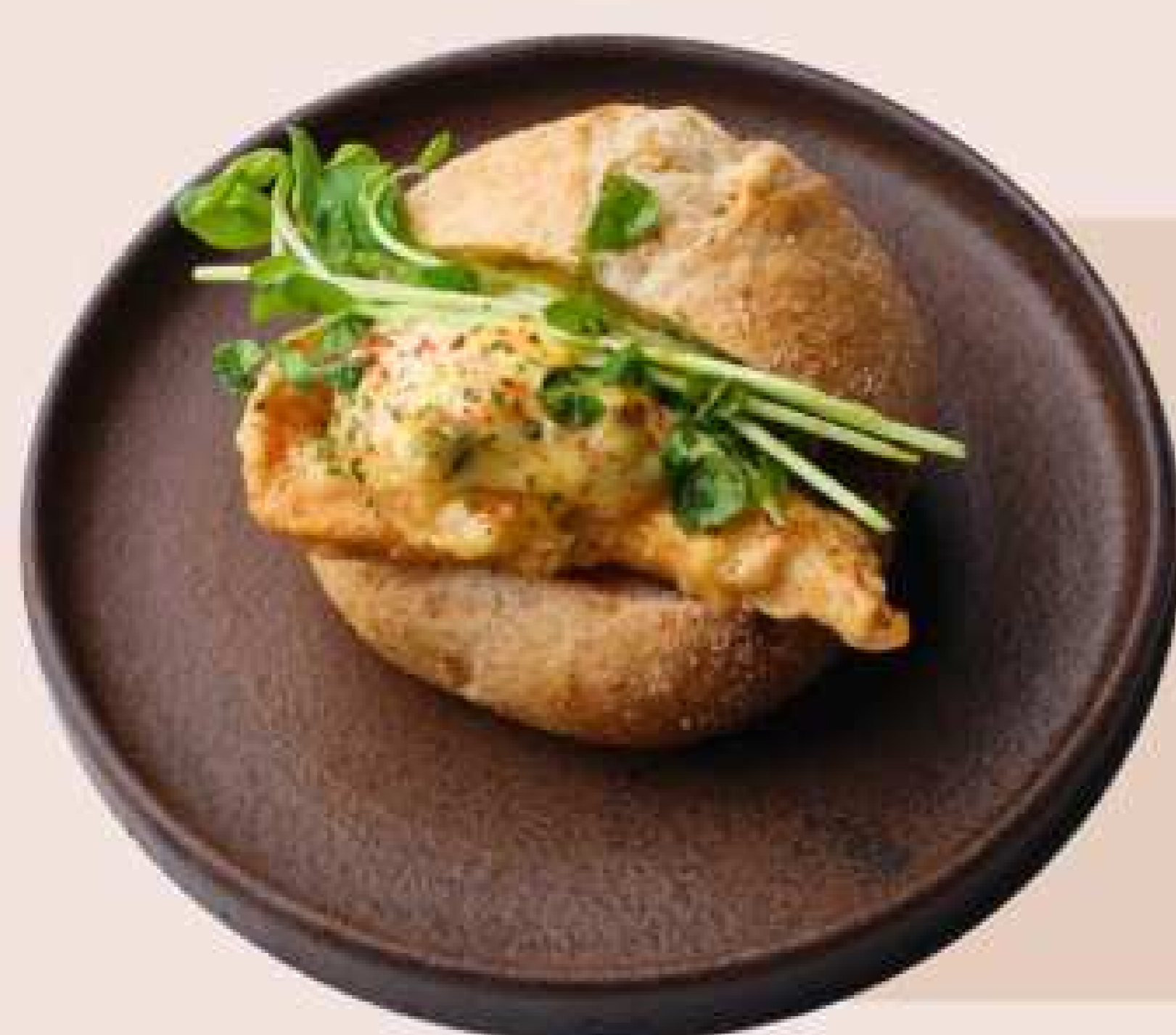
はみ出るチキン南蛮サンド