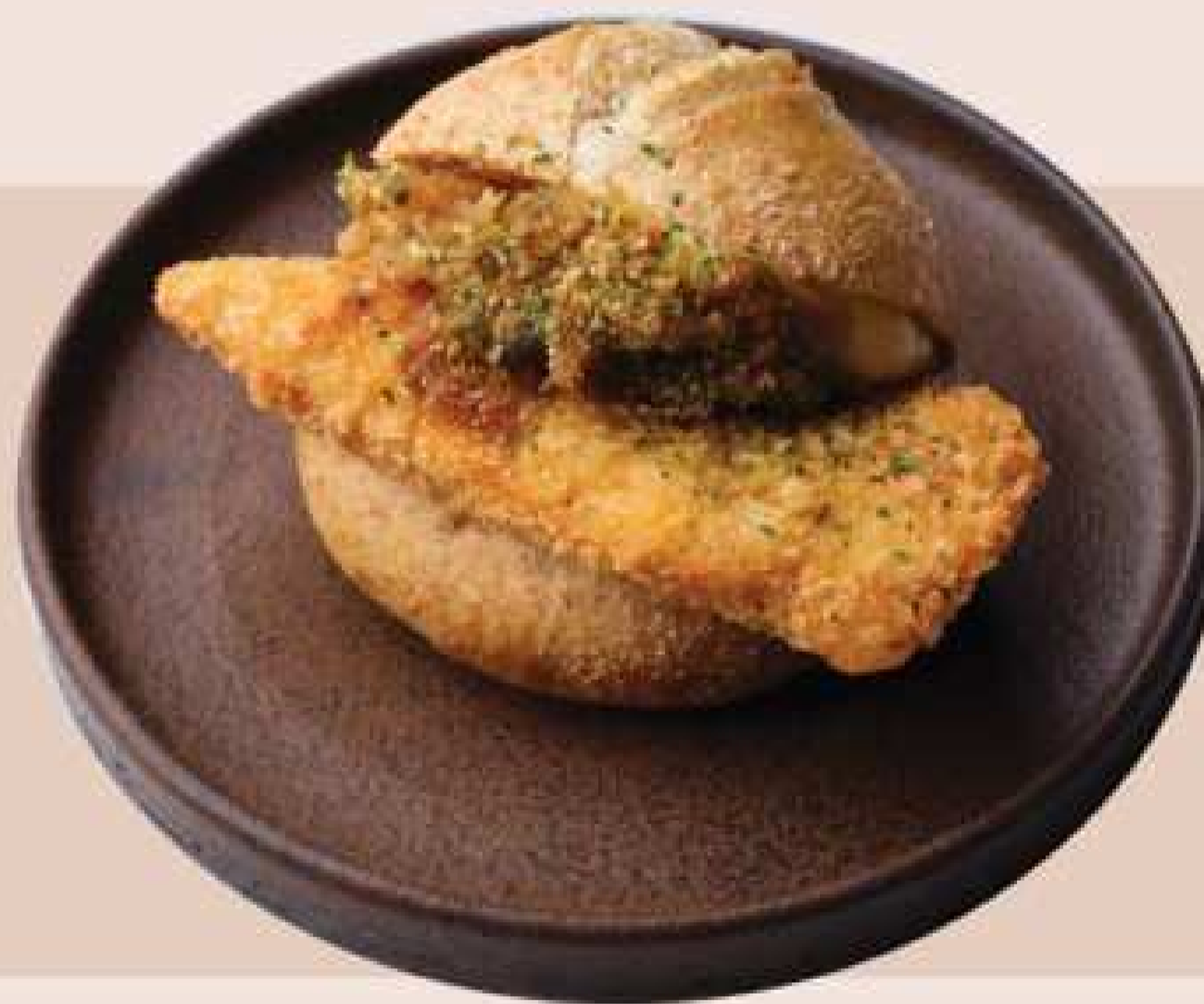
Cheesy Katsu Curry

Sweet and sour fried chicken sandwich, topped with tartar sauce.