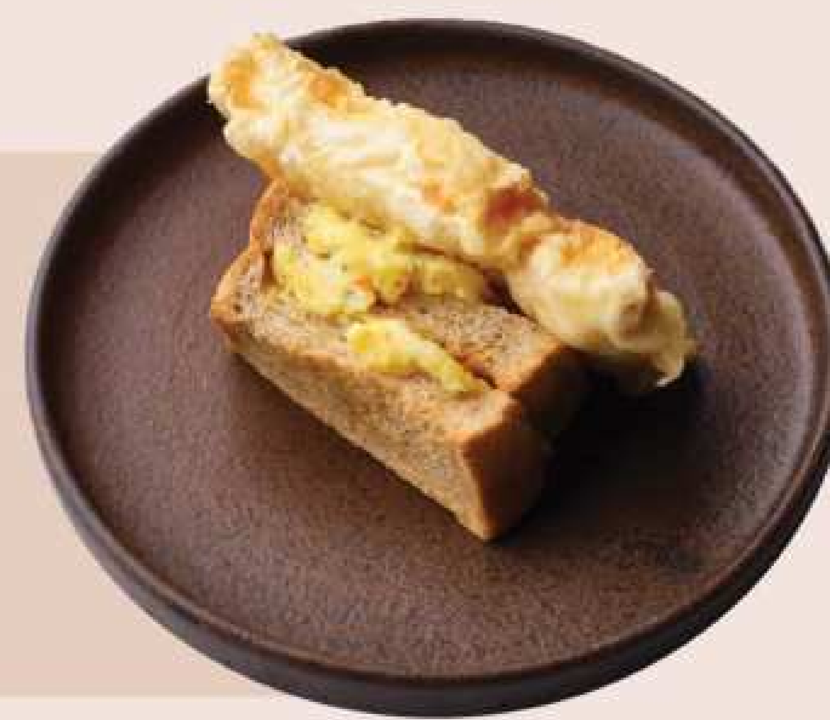
だし巻きたまごのフリットサンド

全粒粉ロールにチキンカツ、シェフ特製のカレー、チーズクリームをサンドしたカレーパン。