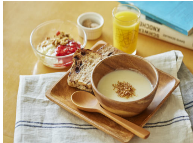
B Seasonal Potage w/ Yanesen Bread 季節野菜のポタージュ / 谷根千のパン付き